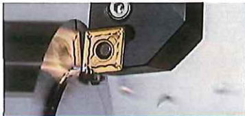
長寿命への挑戦。新世代CVDコーティング