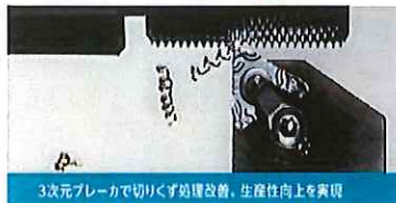
3次元ブレーカで切りくず処理改善。生産性向上を実現