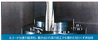
4コーナ仕様で経済的。最大6Dの深穴加工でも優れた切りくず排出性